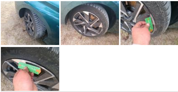
Jante alum. ARG bi-ton/polychrome, Griffe(s), Réparer/rempl. (montant forfaitaire)