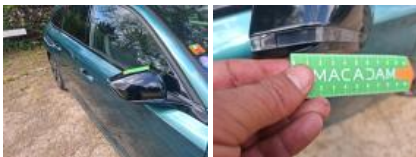
Porte AVD, Griffe(s), Peindre