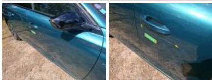
Porte ARD, Griffe(s), Peindre