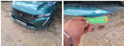
Pare-chocs AV, Déformé / Forcé, LI - Réparer et peindre (complet)