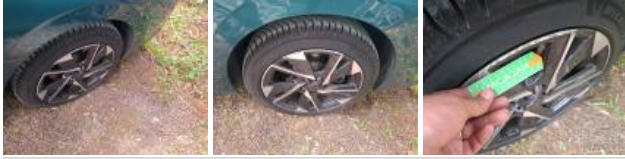
Jante alum. ARD bi-ton/polychrome, Griffe(s), Réparer/rempl. (montant forfaitaire)