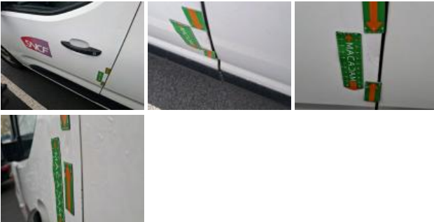
Panneau ARG, Bosse(s), LI - Réparer et peindre (complet)