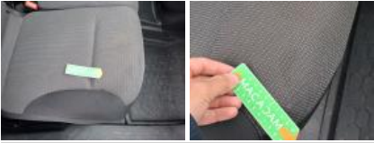
Revêtement assise siège AVD, Dégâts chimiques, E - Remplacer