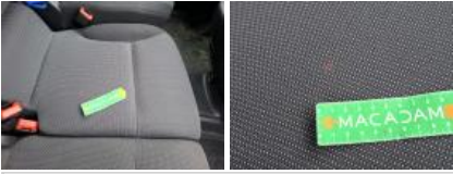
Revêtement dossier AVD, Tache, Nettoyer