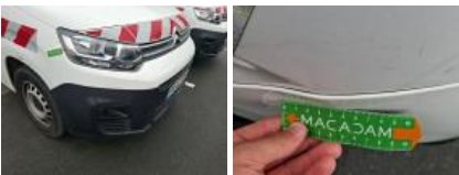
Pare-chocs AV, Cassé, LI - Réparer et peindre (complet)