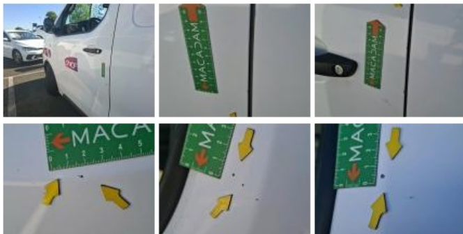
Panneau Latéral G, Eclat(s), Peindre