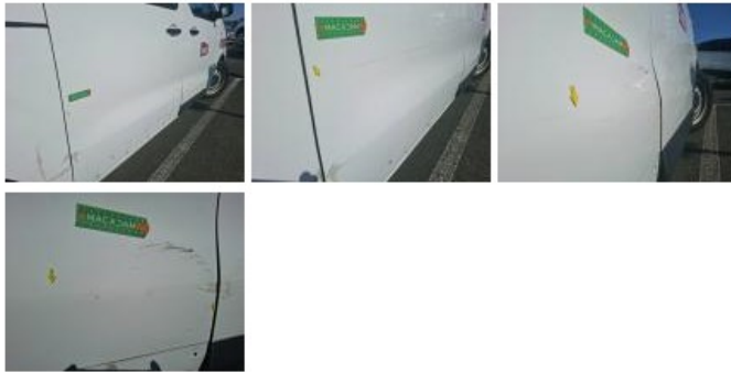
Moulure porte ARD, Manque, E - Remplacer