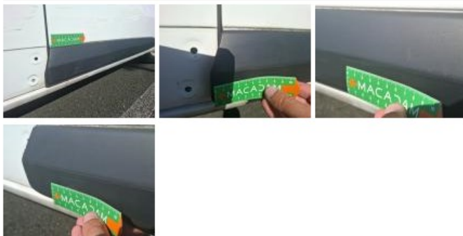
Aile AVD, Eclat(s), Acceptable