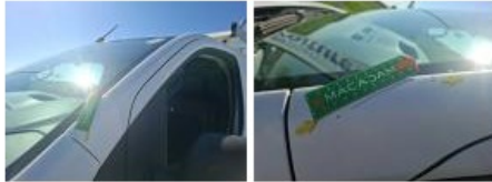
Porte AVG, Griffe(s), Peindre