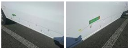
Bas de caisse ext D, Griffe(s), Peindre