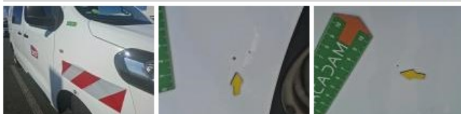
Pare-chocs AR, Griffe(s), E - Remplacer