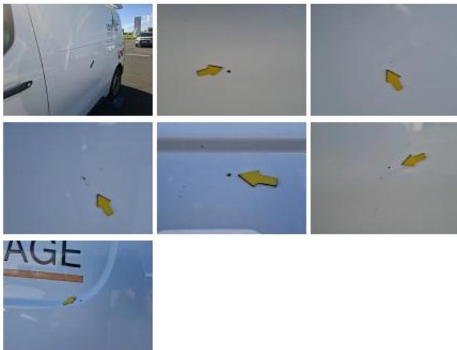
Capot, Eclat(s), Peindre