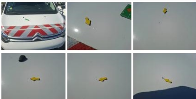
Pare-chocs AV, Griffe(s), Réparer/rempl. (montant forfaitaire)