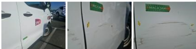
Moulure porte AVD, Griffe(s), E - Remplacer