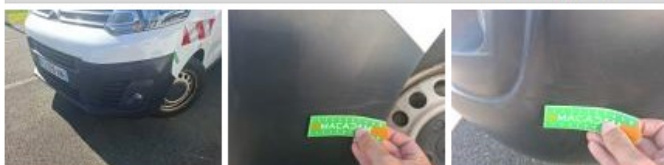
Panneau ARD, Bosse(s) et griffe(s), LI - Réparer et peindre (complet)