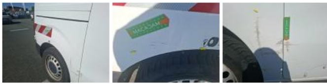
Porte coulissante D, Bosse(s) et griffe(s), LI - Réparer et peindre (complet)