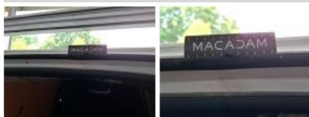
Pare-chocs AR, Déformé / Forcé, Réparer/rempl. (montant forfaitaire)