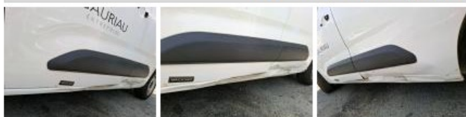
Porte coulissante D, Bosse(s) et griffe(s), LI - Réparer et peindre (complet)