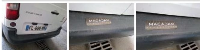
Porte de malle AR G, Bosse(s) et griffe(s), LI - Réparer et peindre (complet)