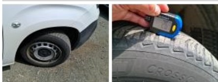
Aile AVG, Eclat(s), Peindre