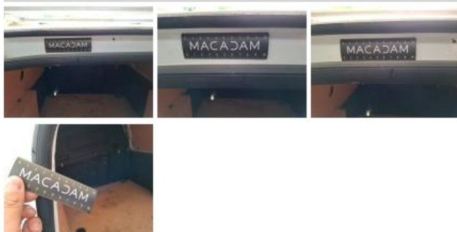
Joint de coffre/hayon, Déchirure, E - Remplacer