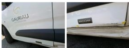
Bas de caisse ext G, Bosse(s) et griffe(s), Le - Remplacer et peindre