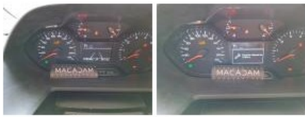
Intérieur, Tache, Nettoyer