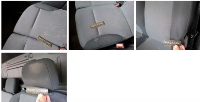
Revêtement assise siège AVG, Dégâts chimiques, E - Remplacer