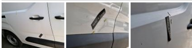
Panneau ARD, Bosse(s) et griffe(s), LI - Réparer et peindre (complet)