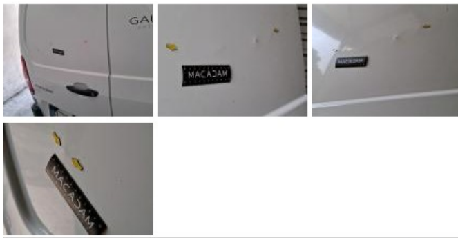
Porte de malle AR D, Eclat(s), Peindre