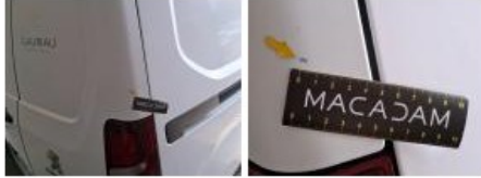
Pavillon caisse, Rouille, Peindre