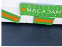
Pavillon cabine, Griffe(s), Peindre