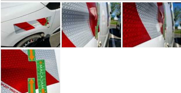
Panneau ARG, Bosse(s) et griffe(s), LI - Réparer et peindre (complet)