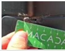
Feu ARG, Griffe(s), E - Remplacer