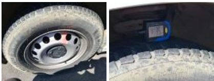
Pneu ARG, Hors tolérance, E - Remplacer