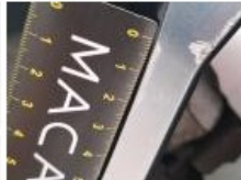
Jante alum. AVD bi-ton/polychrome, Griffe(s), Réparer/rempl. (montant forfaitaire)