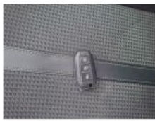
Revêtement assise ARD, Tache, Nettoyer