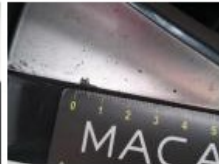
Porte AVG, Bosse(s) et griffe(s), Acceptable