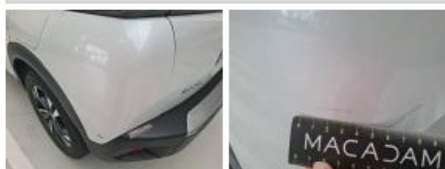
Moulure de pare-chocs AR, Griffe(s), Acceptable