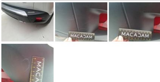
Coin pare-chocs ARG, Griffe(s), Lustrage