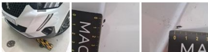
Boitier rétroviseur ext D, Griffe(s), Peindre