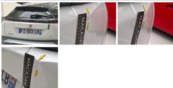
Pare-chocs AR, Griffe(s), E - Remplacer