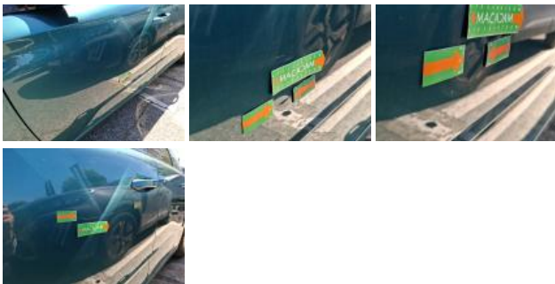
Porte ARG, Griffe(s), Peindre