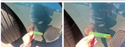
Aile ARD, Griffe(s), Peindre