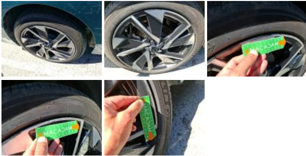
Jante alum. AVD bi-ton/polychrome, Griffe(s), Réparer/rempl. (montant forfaitaire)