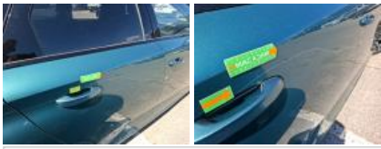
Porte AVD, Griffe(s), Peindre