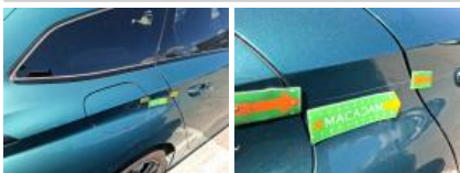
Porte ARD, Griffe(s), Peindre