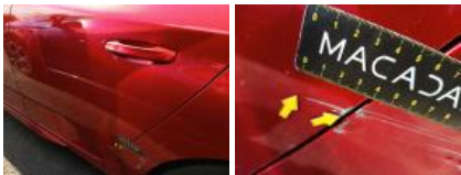
Aile ARG, Bosse(s) et griffe(s), LI - Réparer et peindre (complet)