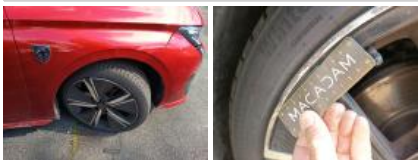
Aile AVG, Griffes, Lustrage