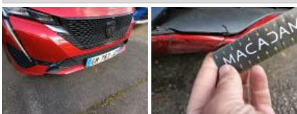
Grille de pare-chocs AV M, Déformé / Forcé, E - Remplacer