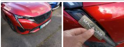
Pare-chocs AV, Cassé, LI - Réparer et peindre (complet)