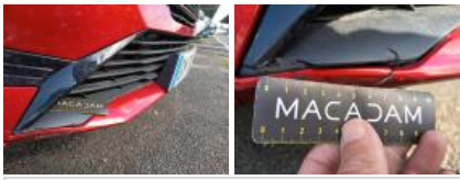
Moulure de pare-chocs AVD, Griffe(s), Acceptable