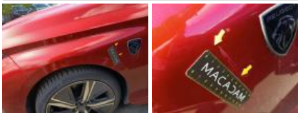
Porte ARG, Griffes(s), Acceptable