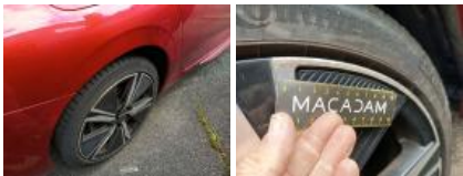
Jante alum. AVD bi-ton/polychrome, Griffes, Réparer/rempl. (montant forfaitaire)