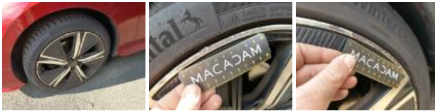
Jante alum. ARG bi-ton/polychrome, Griffes, Réparer/rempl. (montant forfaitaire)