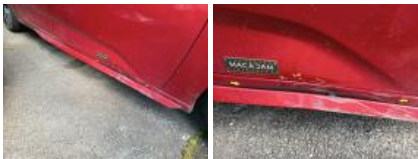
Jupe AR, Griffe(s), Lustrage