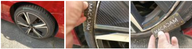
Jante alum. ARD bi-ton/polychrome, Griffes, Réparer/rempl. (montant forfaitaire)