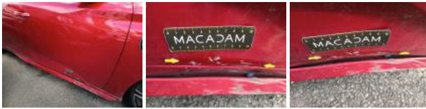
Bas de caisse ext D, Bosse(s) et griffe(s), LI - Réparer et peindre (complet)