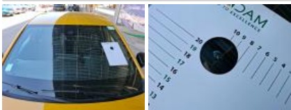
Kit collage vitrage, Nécessaire repose vitrage, Réparer/rempl. (montant forfaitaire)