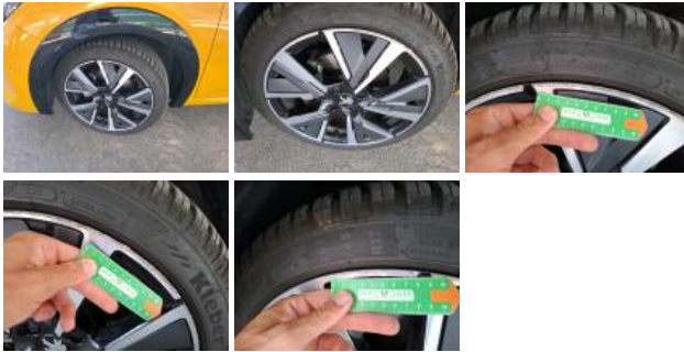
Jante alum. ARG bi-ton/polychrome, Griffe(s), Acceptable