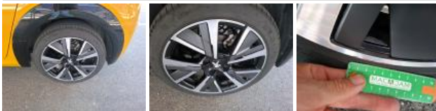
Jante alum. ARD bi-ton/polychrome, Griffe(s), Réparer/rempl. (montant forfaitaire)