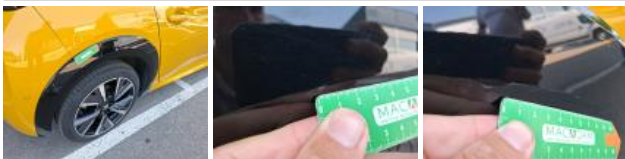
Aile AVD, Griffe(s), Peindre