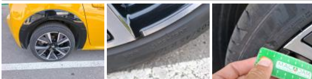
Jante alum. AVD bi-ton/polychrome, Griffe(s), Réparer/rempl. (montant forfaitaire)