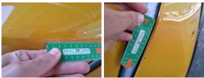
Moulure d'aile ARD, Griffe(s), Acceptable