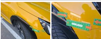
Moulure d'aile AVD, Griffe(s), Peindre