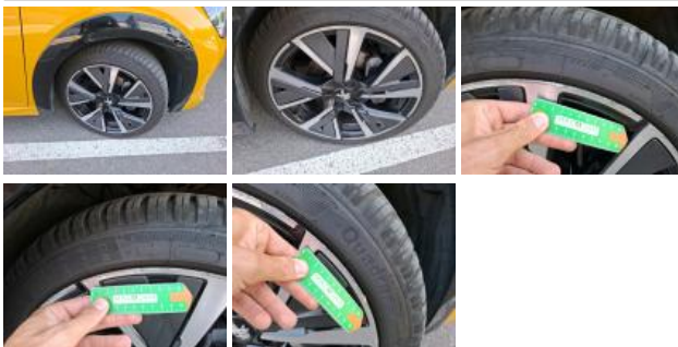
Pneu AVD, Déchirure, E - Remplacer