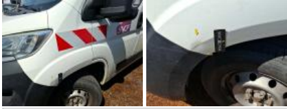
Base rétroviseur ext G, Griffes(s), Acceptable