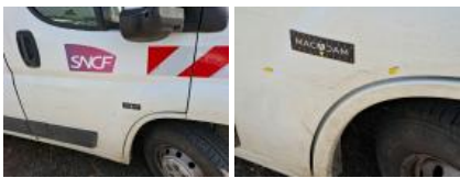
Bas de caisse ext D, Bosse(s) et griffe(s), LI - Réparer et peindre (complet)