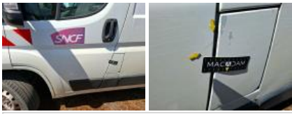
Bas de caisse ext G, Bosse(s), LI - Réparer et peindre (complet)