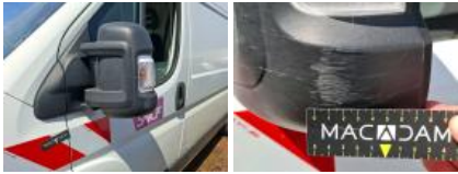
Répétiteur G, Cassé, E - Remplacer