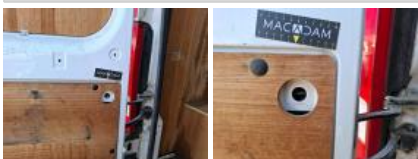
Bouton arrêt porte malle, Manque, E - Remplacer