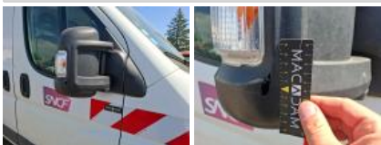
Répétiteur D, Cassé, E - Remplacer