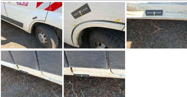
Porte coulissante D, Bosse(s), LI - Réparer et peindre (complet)