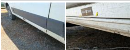
Panneau ARD, Rouille, Peindre