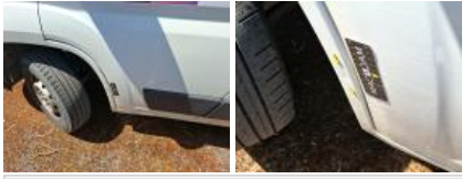
Aile AVG, Bosse(s), LI - Réparer et peindre (complet)