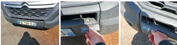
Obtrateur /Cache AV, Manque, E - Remplacer