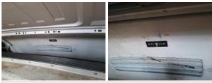
Pavillon caisse, Bosse(s), LI - Réparer et peindre (complet)