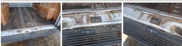
Pare-chocs AR, Déformé / Forcé, E - Remplacer