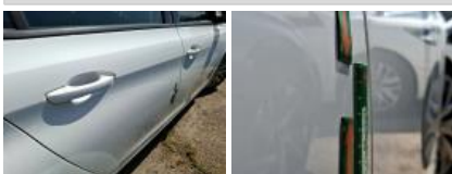
Aile AVD, Griffe(s), Acceptable