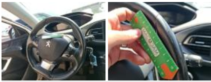
Garnit. montant Mil G, Griffe(s), Réparer/rempl. (montant forfaitaire)