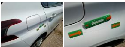
Porte ARD, Bosse(s), LI - Réparer et peindre (complet)