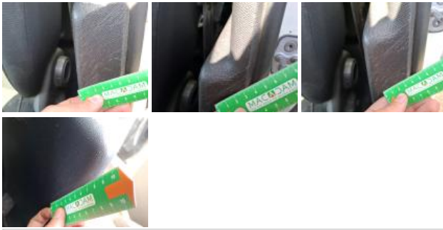
Intérieur, Sale, Nettoyage chimique