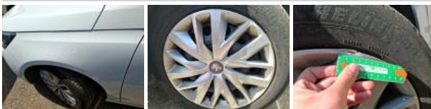
Porte AVG, Bosse(s), Acceptable