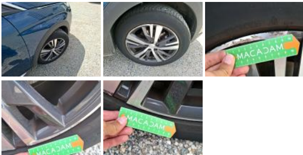
Pneu AVD, Déchirure, E - Remplacer