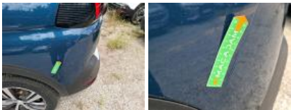
Coin pare-chocs ARD, Déformé / Forcé, Le - Remplacer et peindre