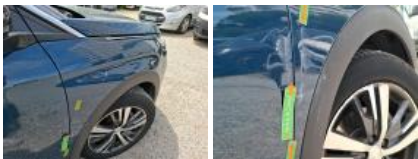
Moulure d'aile AVD, Dégrafé, Dépose/Repose