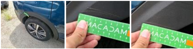
Moulure porte ARD, Déformé / Forcé, E - Remplacer