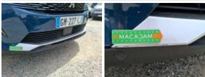
Pare-chocs AV, Déformé / Forcé, Le - Remplacer et peindre