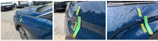
Moulure d'aile AVG, Dégrafé, Dépose/Repose