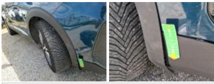
Moulure de pare-chocs AR, Déformé / Forcé, E - Remplacer