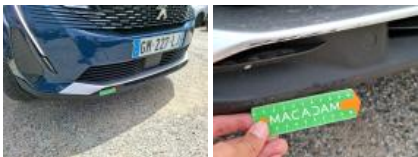
Moulure de pare-chocs AV, Griffe(s), Peindre