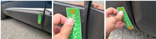
Moulure porte ARG, Griffe(s), E - Remplacer