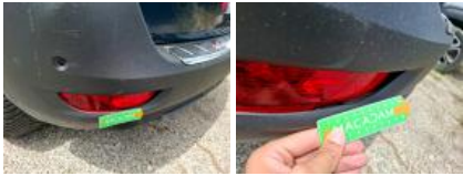
Coffre / hayon, Griffé(s), Peindre