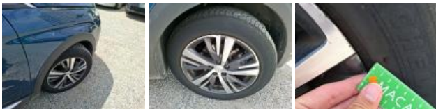
Aile AVG, Bosse(s) et griffe(s), LI - Réparer et peindre (complet)