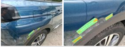
Porte ARD, Bosse(s) et griffe(s), LI - Réparer et peindre (complet)