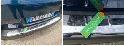
Feu antibrouillard ARG, Dégrafé, Dépose/Repose