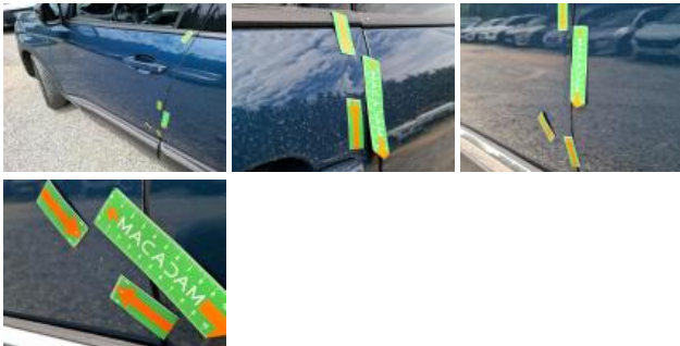
Moulure porte AVG, Griffe(s), E - Remplacer