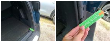
Coin pare-chocs ARG, Dégrafé, Dépose/Repose