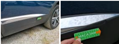
Aile ARG, Bosse(s), LI - Réparer et peindre (complet)