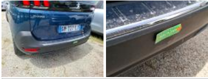
Moulure de pare-chocs AR, Griffé(s), E - Remplacer