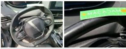
Intérieur, Tache, Nettoyer