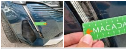
Moulure de pare-chocs AVD, Dégrafé, Dépose/Repose