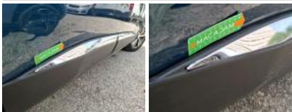
Porte AVD, Bosse(s) et griffe(s), LI - Réparer et peindre (complet)