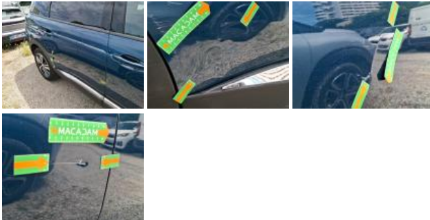
Moulure d'aile ARD, Griffes, E - Remplacer