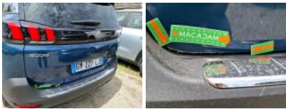
Joint de coffre/hayon, Déchirure, E - Remplacer