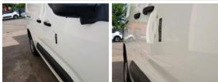
Porte de malle AR D, Bosse(s), LI - Réparer et peindre (complet)