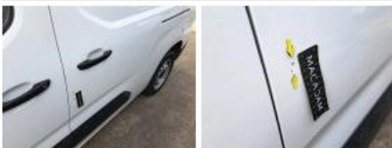
Moulure porte AVG, Griffe(s), Réparer/remplacer (montant forfaitaire)