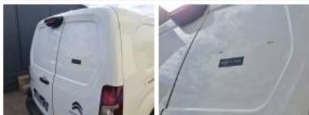
Porte de malle AR G, Bosse(s), LI - Réparer et peindre (complet)