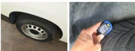
Pneu ARG, Hors tolérance, E - Remplacer