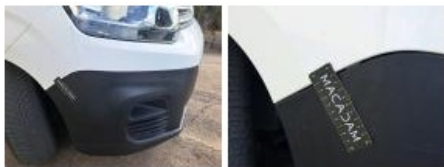
Porte AVD, Bosse(s), LI - Réparer et peindre (complet)