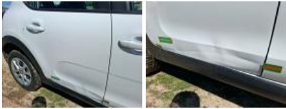
Aile AVD, Bosse(s), LI - Réparer et peindre (complet)