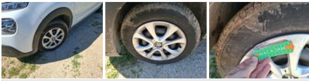
Enjoliveur de roue ARD, Déformé / Forcé, E - Remplacer