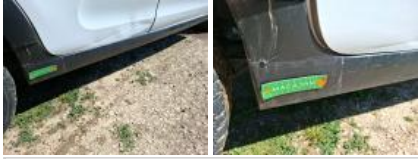
Porte ARD, Bosse(s), LI - Réparer et peindre (complet)