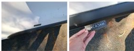
Bas de caisse ext D, Griffe(s), Peindre