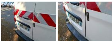
Joint de coffre/hayon, Déchirure, E - Remplacer