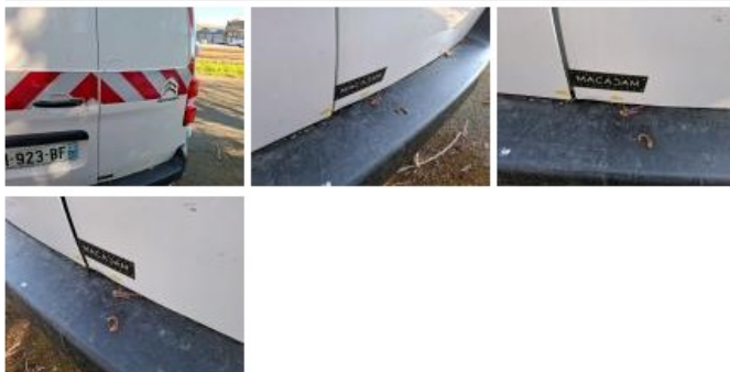
Porte de malle AR G, Griffe(s), Acceptable