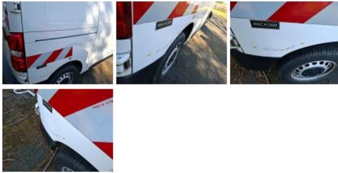
Moulure porte ARD, Griffe(s), Acceptable