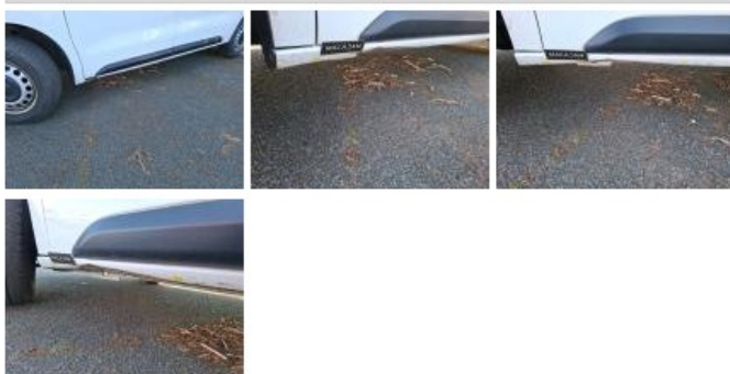
Aile AVG, Griffe(s), Lustrage