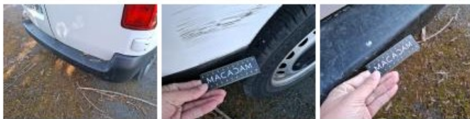
Porte de malle AR D, Bosse(s), LI - Réparer et peindre (complet)