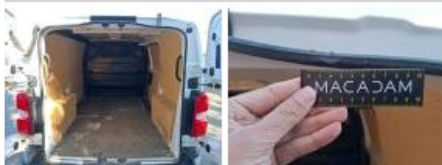
Cloison, Bosse(s), LI - Réparer et peindre (complet)