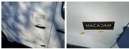
Panneau ARD, Bosse(s) et griffe(s), LI - Réparer et peindre (complet)