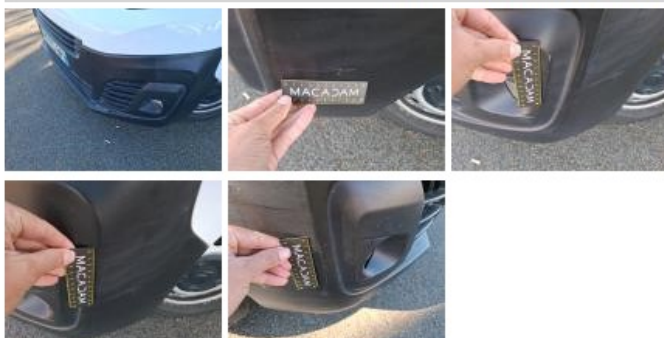
Aile AVD, Griffe(s), Peindre