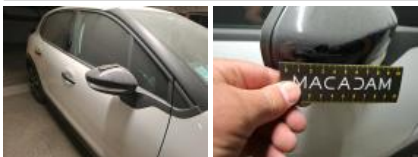
Répétiteur D, Griffe(s), Acceptable