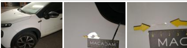
Boitier rétroviseur ext D, Griffe(s), Peindre