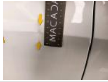
Pare-chocs AR, Différence de teinte, Peindre