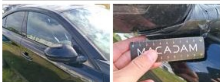
Pare-chocs AR, Griffe(s), Peindre