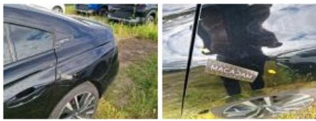
Bas de caisse ext G, Bosse(s), LI - Réparer et peindre (complet)