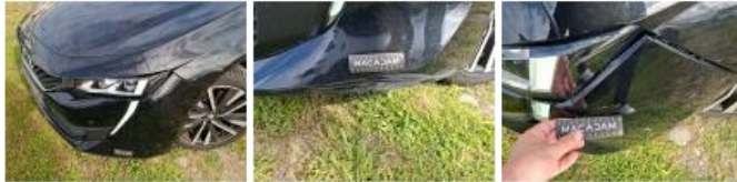
Moulure de pare-chocs AVD, Dégrafé, Dépose/Répose