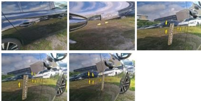
Porte AVD, Bosse(s) et griffe(s), LI - Réparer et peindre (complet)