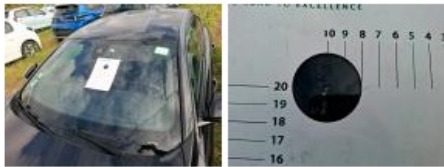
Kit collage vitrage, Nécessaire repose vitrage, Réparer/rempl. (montant forfaitaire)