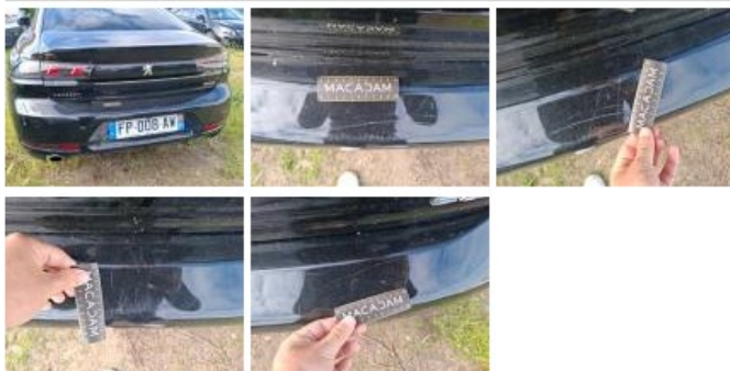
Coffre / hayon, Griffe(s), Acceptable