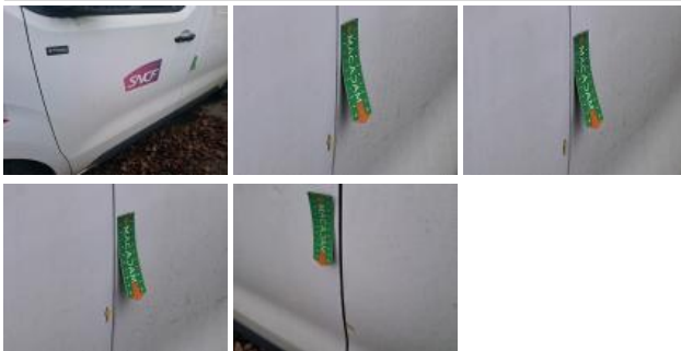
Bas de caisse ext G, Bosse(s) et griffe(s), LI - Réparer et peindre (complet)