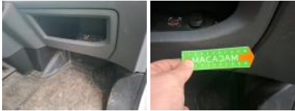
Placage planche de bord, Griffes(s), Réparer/rempl. (montant forfaitaire)