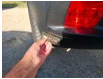
Catadioptr, Cassé, E - Remplacer