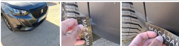
Aile ARD, Bosse(s), LI - Réparer et peindre (complet)