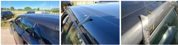
Porte ARG, Griffe(s), Peindre