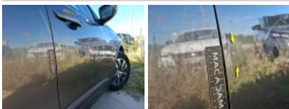
Moulure d'aile AVD, Griffe(s), E - Remplacer