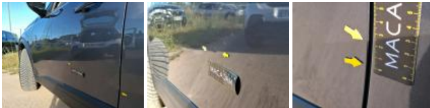
Moulure porte AVG, Griffe(s), Réparer/rempl. (montant forfaitaire)