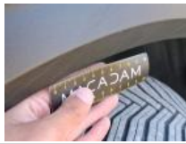
Coin pare-chocs ARG, Griffe(s), Peindre