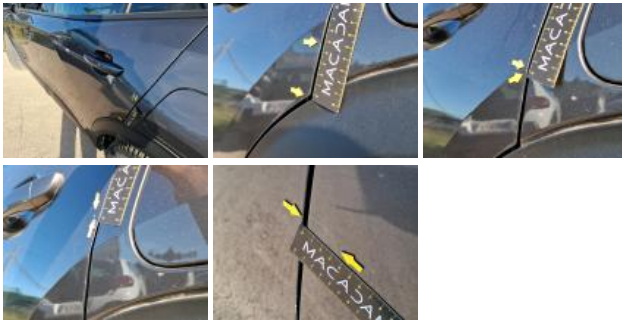
Porte AVG, Bosse(s) et griffe(s), LI - Réparer et peindre (complet)