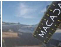
Pare-chocs AR, Griffe(s), E - Remplacer