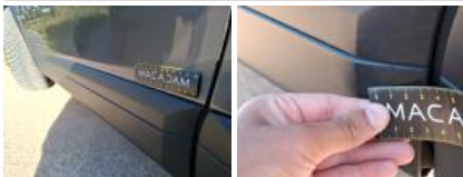
Moulure de pare-chocs AV, Griffe(s), Réparer/rempl. (montant forfaitaire)