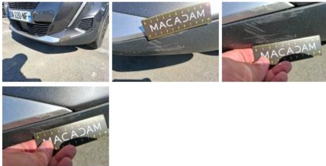
Pare-chocs AV, Griffe(s), Peindre