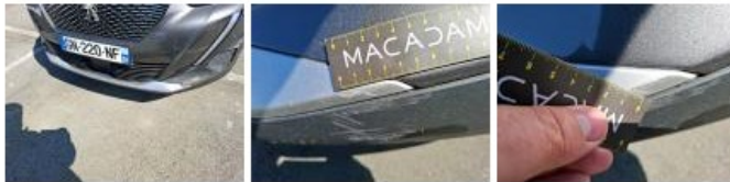
Moulure de pare-chocs AV, Griffe(s), E - Remplacer