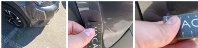
Aile ARD, Bosse(s) et griffe(s), Acceptable