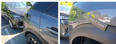
Porte ARD, Bosse(s) et griffe(s), Acceptable