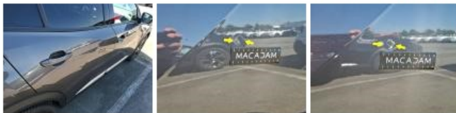
Porte AVD, Bosse(s), Acceptable