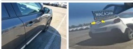
Moulure d'aile AVD, Griffe(s), E - Remplacer