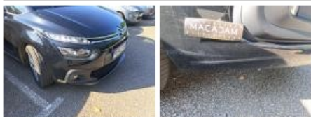
Bas de caisse ext D, Bosse(s) et griffe(s), LI - Réparer et peindre (complet)