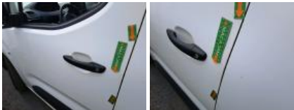
Panneau ARG, Bosse(s), LI - Réparer et peindre (complet)