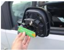
Glace rétro. ext G, Manqué, E - Remplacer