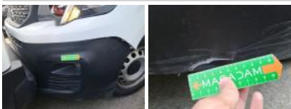
Moulure de pare-chocs AV, Cassé, Le - Remplacer et peindre