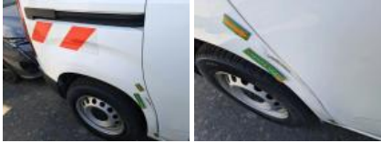
Porte coulissante D, Bosse(s) et griffe(s), LI - Réparer et peindre (complet)