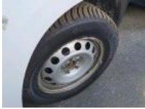
Protect. pass. roue AVG, Cassé, E - Remplacer