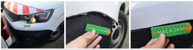
Moulure de pare-chocs AVG, Griffe(s), Réparer/rempl. (montant forfaitaire)