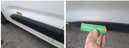
Porte AVG, Griffe(s), Acceptable