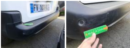
Carrosserie, Pas d'origine, Délettrage