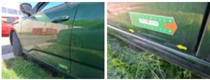
Bas de caisse ext G, Bosse(s) et griffe(s), LI - Réparer et peindre (complet)