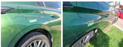
Porte ARD, Bosse(s) et griffe(s), LI - Réparer et peindre (complet)