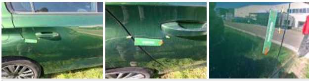
Porte AVD, Griffe(s), Acceptable