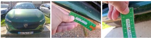
Grille de pare-chocs AV M, Cassé, E - Remplacer