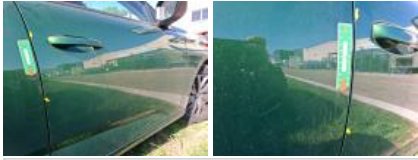
Poignée ext porte AVD, Griffe(s), Acceptable