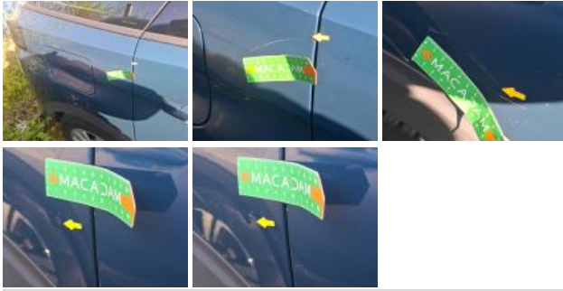
Aile AVD, Griffe(s), Peindre