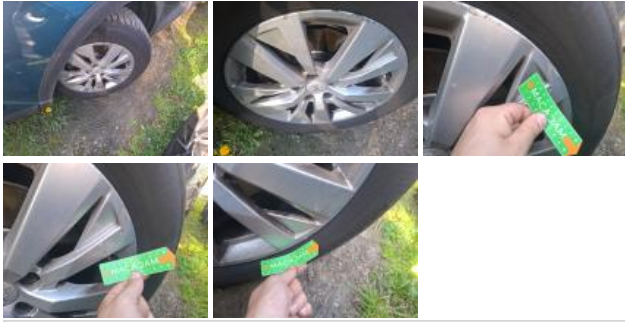
Jante alum. ARD, Griffe(s), Réparer/rempl. (montant forfaitaire)