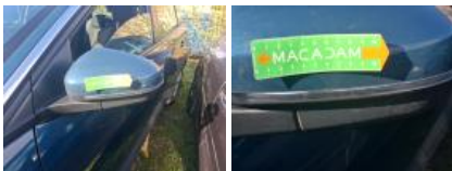
Porte ARG, Eclat(s), Acceptable