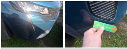
Aile ARD, Bosse(s) et griffe(s), LI - Réparer et peindre (complet)