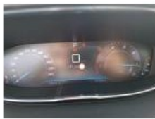
Intérieur, Tache, Nettoyer