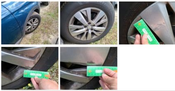
Pneu ARG, Hors tolérance, E - Remplacer