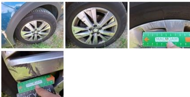
Jante alum. ARD, Griffes(s), Acceptable