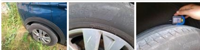
Jante alum. AVD, Griffes(s), Réparer/rempl. (montant forfaitaire)