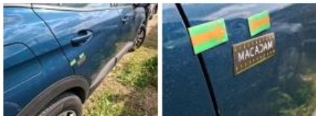
Porte AVD, Bosse(s), LI - Réparer et peindre (complet)