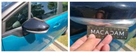
Porte AVG, Bosse(s) et griffe(s), LI - Réparer et peindre (complet)