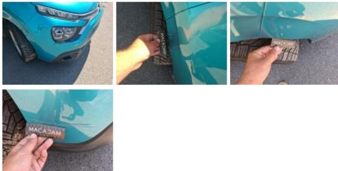
Pare-chocs AV, Griffe(s), E - Remplacer