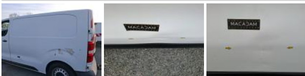
Pare-chocs AV, Déformé / Forcé, E - Remplacer