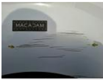
Porte coulissante D, Bosse(s) et griffe(s), LI - Réparer et peindre (complet)