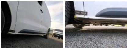
Moulure porte AVG, Griffe(s), E - Remplacer