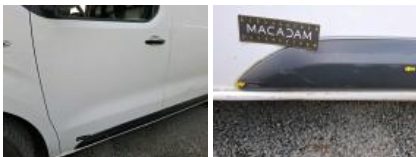
Panneau ARG, Bosse(s), LI - Réparer et peindre (complet)