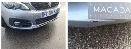
Grille de pare-chocs AV M, Dégrafé, Dépose/Répose