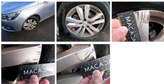
Jante alum. AVD, Griffe(s), E - Remplacer