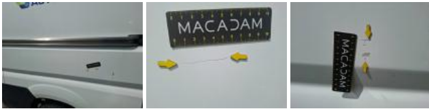
Porte AVD, Bosse(s) et griffe(s), LI - Réparer et peindre (complet)