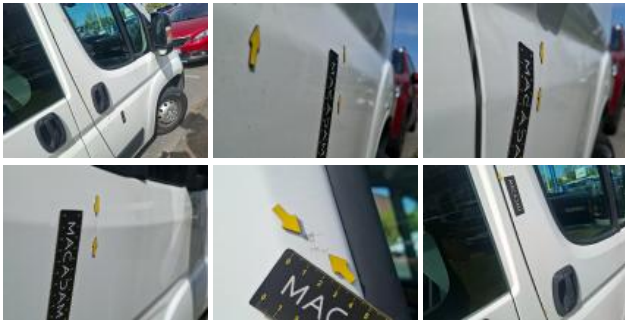
Bas de caisse ext D, Griffe(s), Peindre