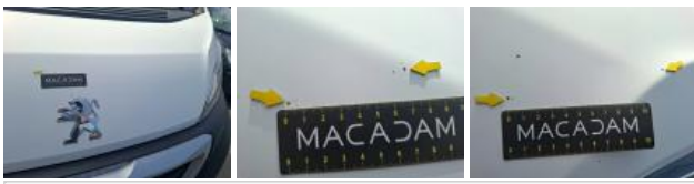
Panneau ARD, Griffe(s), Peindre