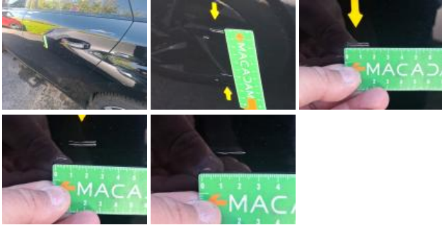
Aile ARG, Bosse(s) et griffe(s), LI - Réparer et peindre (complet)