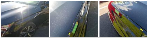
Porte AVG, Griffe(s), Acceptable