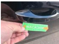
Bas de caisse ext D, Bosse(s) et griffe(s), LI - Réparer et peindre (complet)