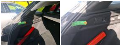
Garnit. zone de chargement, Griffe(s), Réparer/rempl. (montant forfaitaire)