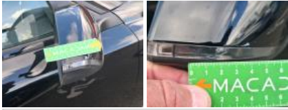
Boitier rétroviseur ext D, Griffe(s), Réparer/rempl. (montant forfaitaire)