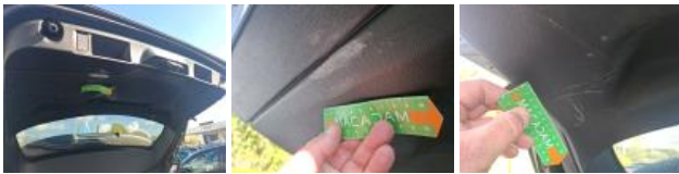
Garnit. int G coffre, Griffe(s), Réparer/rempl. (montant forfaitaire)