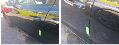
Porte ARG, Griffe(s), Peindre