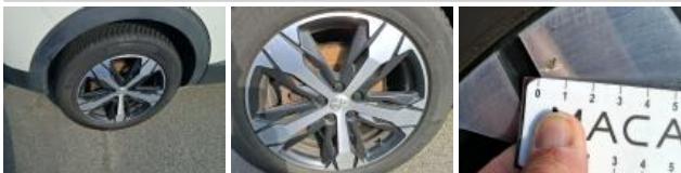
Jante alum. ARG bi-ton/polychrome, Griffe(s), E - Remplacer