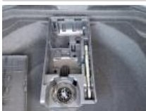
Kit réparation pneu, Manque, Réparer/rempl. (montant forfaitaire)