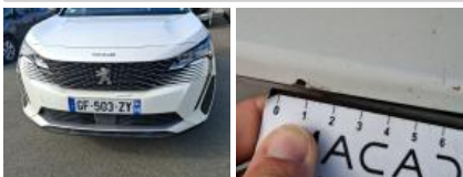
Calandre, Cassé, E - Remplacer