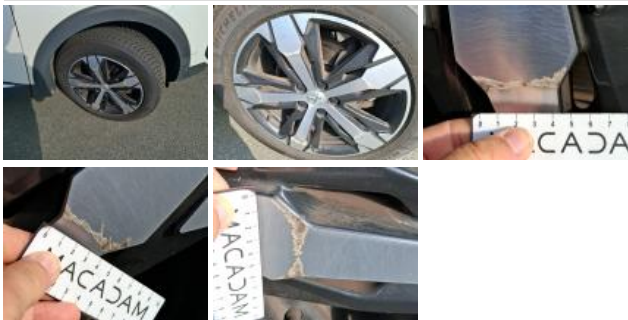
Jante alum. ARD bi-ton/polychrome, Griffe(s), Acceptable