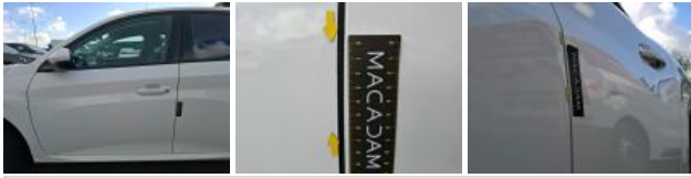
Aile ARG, Bosse(s) et griffe(s), LI - Réparer et peindre (complet)