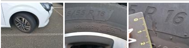
Jante alum. AVD bi-ton/polychrome, Griffes, E - Remplacer