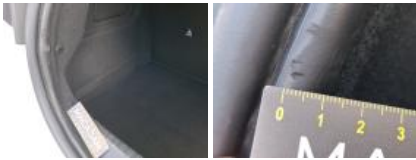
Tapis de coffre, Tache, Nettoyer