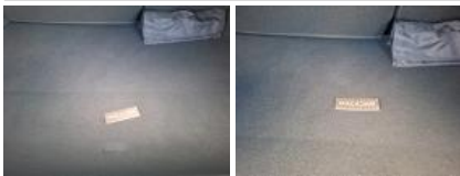
Garnit. zone de chargement, Griffe(s), Réparer/rempl. (montant forfaitaire)