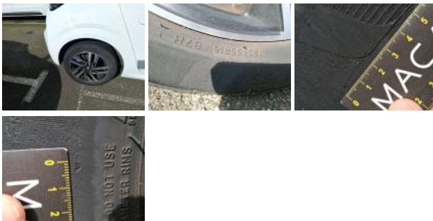
Jante alum. ARD bi-ton/polychrome, Griffes, E - Remplacer