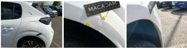
Porte ARD, Bosse(s), Acceptable