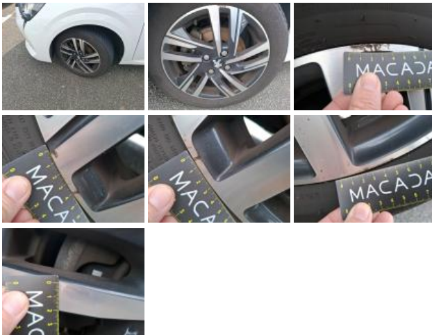
Pneu ARD, Déchirure, E - Remplacer