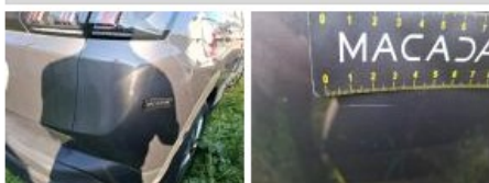
Feu ARD, Griffe(s), Acceptable