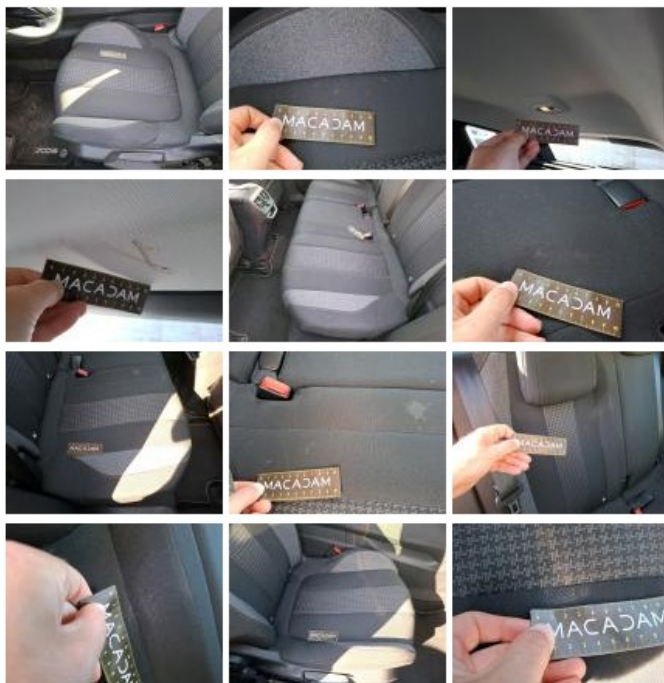
Bas de caisse int ARG, Griffe(s), Peindre