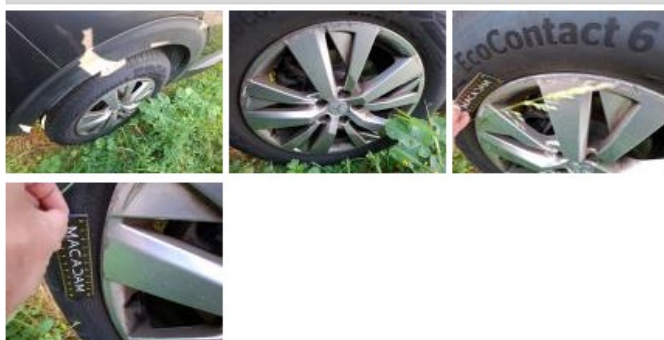
Jante alum. AVD, Griffe(s), Réparer/rempl. (montant forfaitaire)