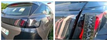
Pare-chocs AR, Griffe(s), Acceptable