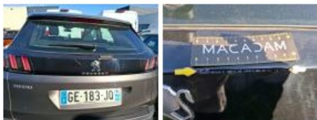
Coin pare-chocs ARG, Griffe(s), Lustrage