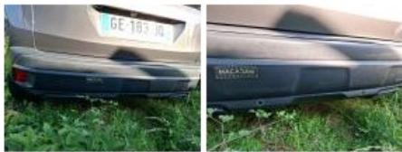
Coffre / hayon, Griffe(s), Peindre