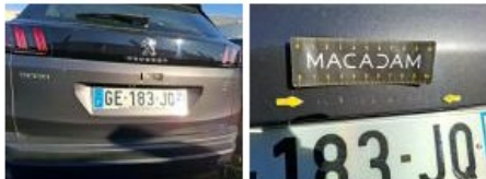
Moulure de coffre, Griffe(s), Peindre