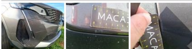
Moulure de pare-chocs AV, Griffe(s), Acceptable