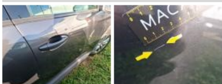
Porte ARD, Griffe(s), Acceptable