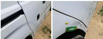
Porte ARD, Bosse(s) et griffe(s), Le - Remplacer et peindre