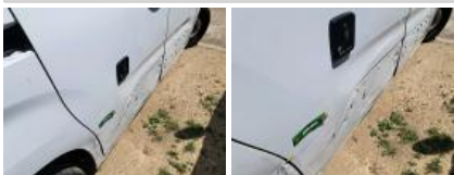
Moulure porte ARD, Manque, E - Remplacer