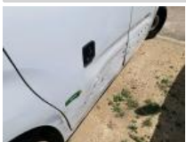
Porte AVD, Bosse(s) et griffe(s), LI - Réparer et peindre (complet)