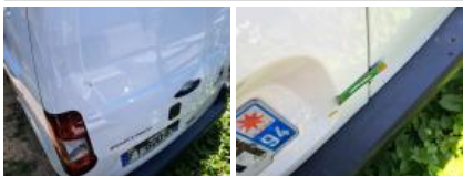
Porte de malle AR D, Bosse(s), LI - Réparer et peindre (complet)