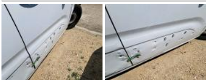
Bas de caisse ext D, Bosse(s) et griffe(s), Le - Remplacer et peindre