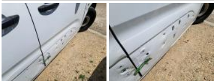
Moulure porte AVD, Manque, E - Remplacer