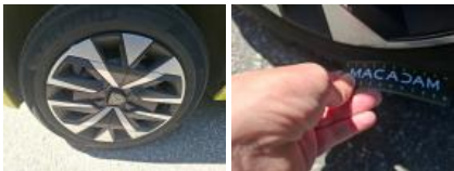
Pneu AVD, Déchirure, E - Remplacer