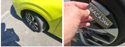
Enjoliveur de roue AVD, Déformé / Forcé, E - Remplacer