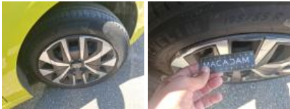
Enjoliveur de roue ARD, Griffe(s), Acceptable