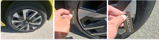
Enjoliveur de roue AVG, Griffe(s), Acceptable