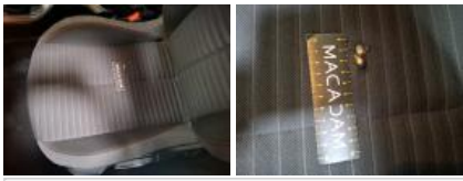
Garniture porte AVG, Brûlé, E - Remplacer