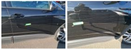
Aile AVD, Griffe(s), Peindre