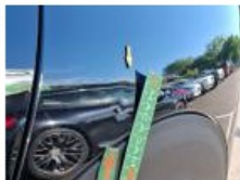
Capot, Griffes(s), Peindre