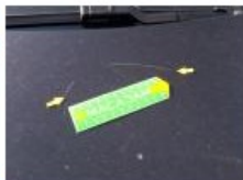
Moulure d'aile ARD, Griffes(s), E - Remplacer