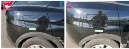
Porte ARD, Griffe(s), Peindre