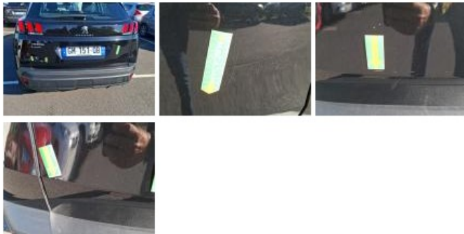
Pare-chocs AR, Griffe(s), Réparer/rempl. (montant forfaitaire)