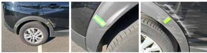
Aile ARD, Griffe(s), Lustrage