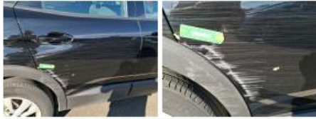
Porte AVD, Griffe(s), Peindre