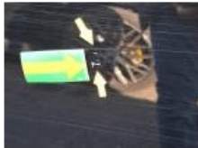
Aile ARG, Bosse(s), LI - Réparer et peindre (complet)