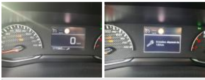
Intérieur, Tache, Nettoyer