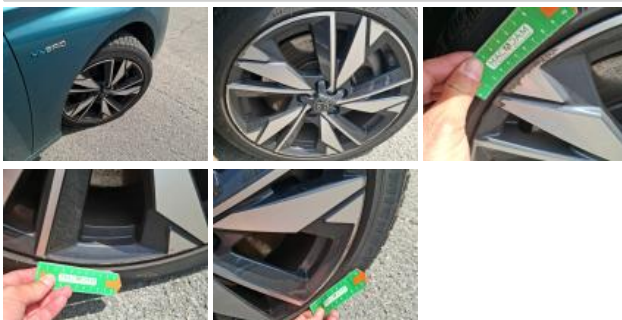
Jante alum. AVG bi-ton/polychrome, Griffes, Réparer/rempl. (montant forfaitaire)