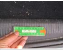
Garnit. couvercle AR, Griffe(s), Réparer/rempl. (montant forfaitaire)