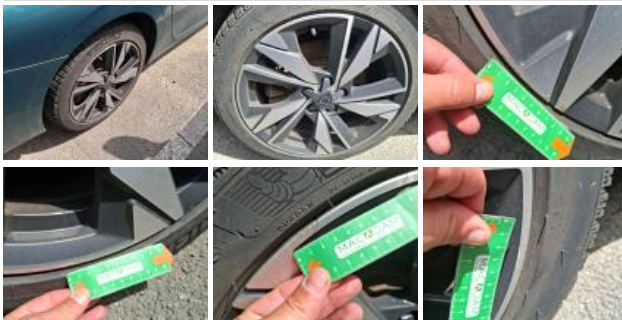
Jante alum. AVD bi-ton/polychrome, Griffes, Réparer/rempl. (montant forfaitaire)