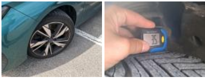
Pneu ARD, Déchirure, E - Remplacer