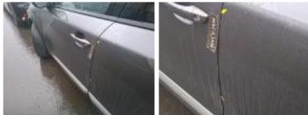
Porte ARD, Griffe(s), Acceptable