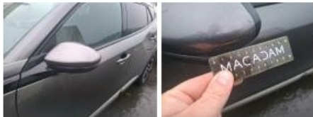
Base rétroviseur ext G, Griffe(s), Acceptable