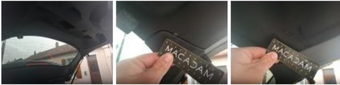
Garnit. int D coffre, Griffe(s), Réparer/rempl. (montant forfaitaire)