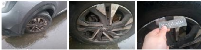
Pneu AVD, Hors tolérance, E - Remplacer