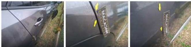
Coin pare-chocs ARG, Griffe(s), Acceptable