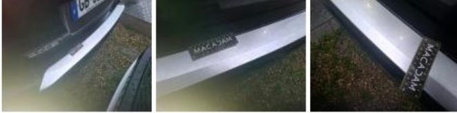
Garnit. couvercle AR, Griffe(s), Acceptable