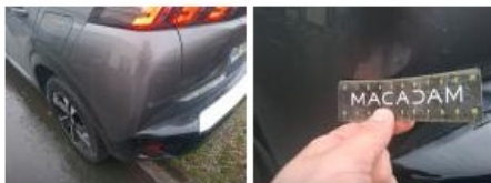
Pare-chocs AR, Griffe(s), Acceptable