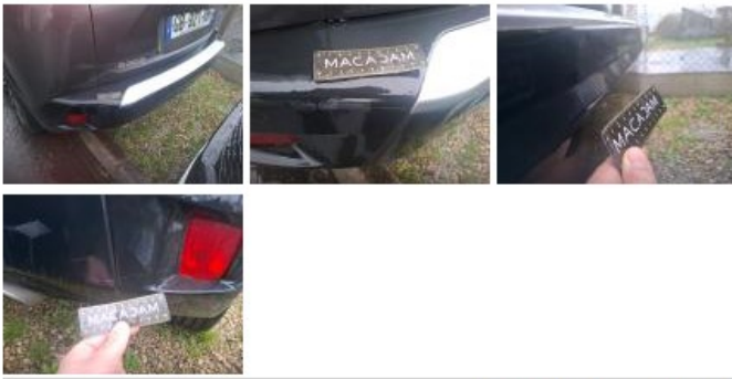
Moulure de pare-chocs AR, Griffe(s), Acceptable