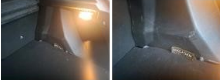
Garnit. int G coffre, Griffe(s), Réparer/rempl. (montant forfaitaire)