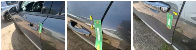
Jt ext lèche-vitre AVG, Dégrafé, Dépose/Repose