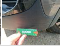
Moulure d'aile ARD, Griffe(s), E - Remplacer