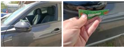
Porte AVG, Bosse(s) et griffe(s), LI - Réparer et peindre (complet)