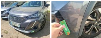
Moulure de pare-chocs AVD, Griffe(s), Lustrage