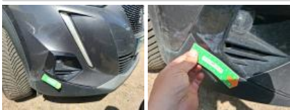
Moulure de pare-chocs AV, Cassé, E - Remplacer