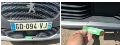
Moulure de pare-chocs AVG, Griffe(s), Peindre