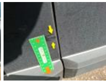
Moulure de pare-chocs AR, Griffe(s), Peindre