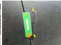
Porte ARD, Griffe(s), Peindre