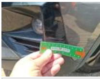
Spoiler AV, Griffe(s), E - Remplacer