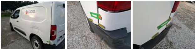
Panneau ARD, Bosse(s) et griffe(s), LI - Réparer et peindre (complet)