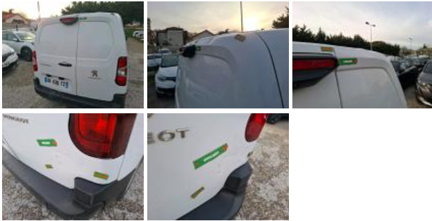
Coin pare-chocs ARD, Déformé / Forcé, LI - Réparer et peindre (complet)