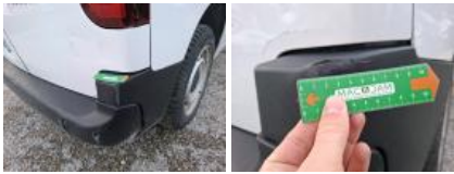
Porte de malle AR G, Bosse(s), LI - Réparer et peindre (complet)