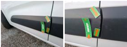
Porte AVG, Bosse(s) et griffe(s), LI - Réparer et peindre (complet)