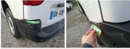
Pare-chocs AR, Déformé / Forcé, E - Remplacer