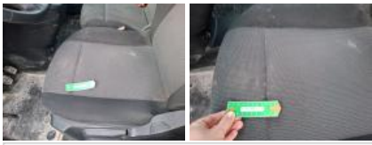
Revêtement dossier AVG, Tache, Nettoyer