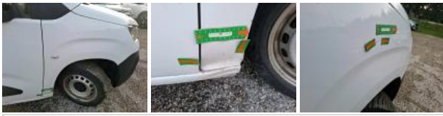
Coin pare-chocs ARG, Déformé / Forcé, LI - Réparer et peindre (complet)