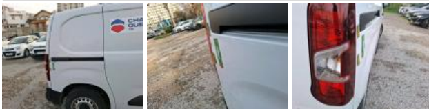
Bas de caisse ext D, Bosse(s) et griffe(s), LI - Réparer et peindre (complet)