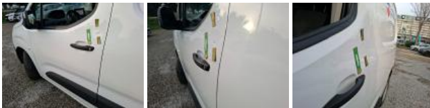
Panneau ARG, Bosse(s), LI - Réparer et peindre (complet)