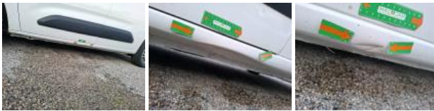
Moulure porte AVG, Griffe(s), Réparer/rempl. (montant forfaitaire)