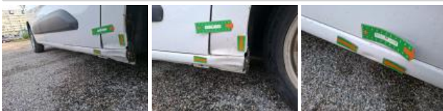
Aile AVD, Bosse(s) et griffe(s), LI - Réparer et peindre (complet)