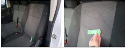
Revêtement assise siège AVD, Tache, Nettoyer