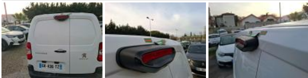
Carrosserie, Pas d'origine, Délettrage