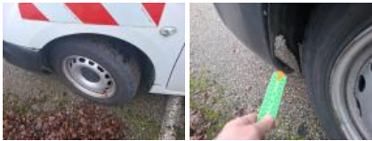
Enjoliveur de roue ARG, Manque, E - Remplacer