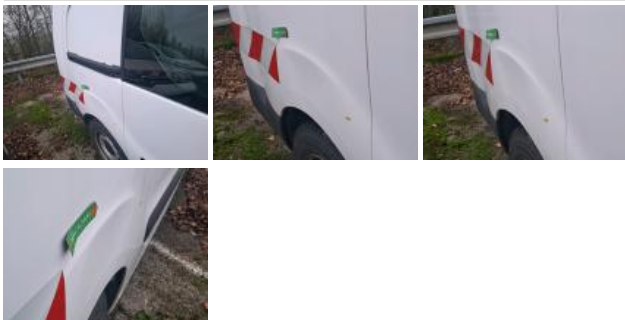
Aile AVD, Bosse(s), LI - Réparer et peindre (complet)