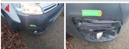
Pare-chocs AV, Cassé, E - Remplacer