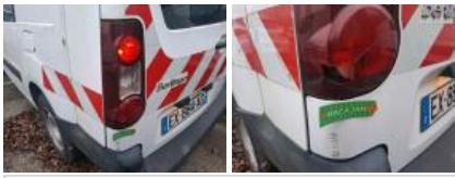
Pare-chocs AR, Déformé / Forcé, E - Remplacer