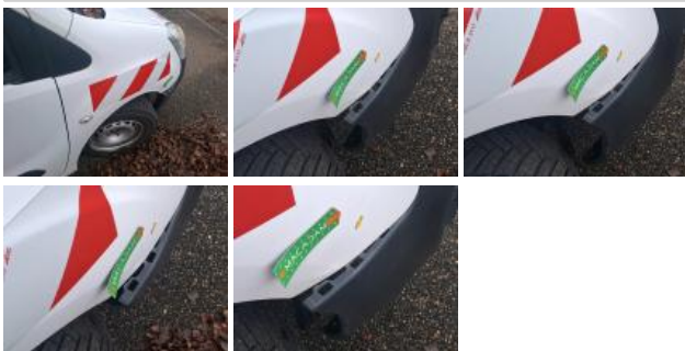
Coin pare-chocs ARG, Déformé / Forcé, E - Remplacer