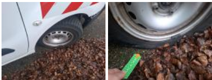
Enjoliveur de roue AVD, Manque, E - Remplacer