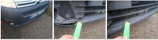
Grille de pare-chocs AV M, Déformé / Forcé, E - Remplacer