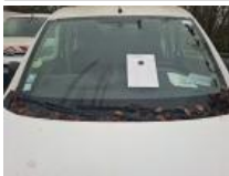
Pare-brise, Eclat(s), E - Remplacer