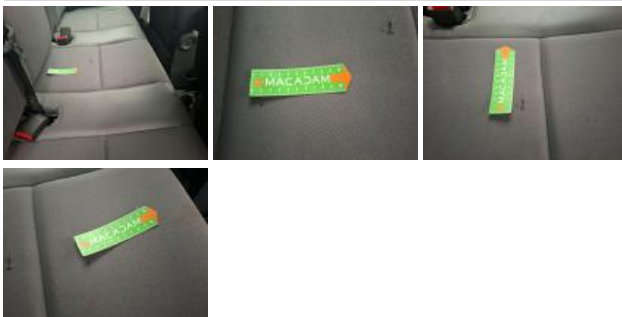
Revêtement dossier AVG, Tache, Nettoyer