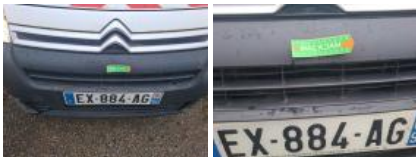
Moulure de pare-chocs AVG, Manque, E - Remplacer