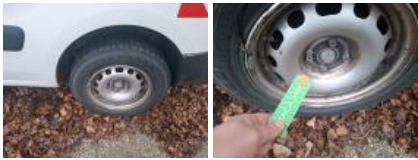
Pneu AVD, Plat, E - Remplacer