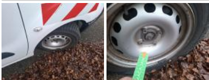
Protect. pass. roue AVD, Cassé, E - Remplacer