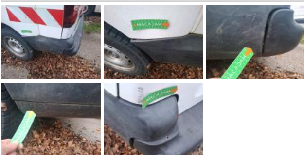
Feu ARG, Cassé, E - Remplacer