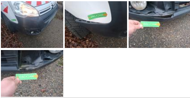
Grille de pare-chocs AV M, Cassé, E - Remplacer