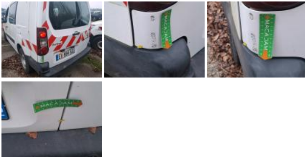
Carrosserie, Pas d'origine, Acceptable