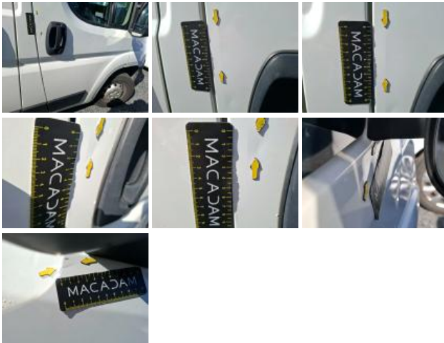
Base rétroviseur ext D, Cassé, E - Remplacer