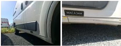
Porte AVD, Bosse(s), LI - Réparer et peindre (complet)