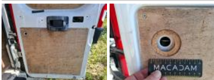
Obtuteur de porte de malle, Manque, E - Remplacer