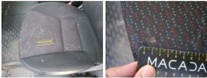
Revêtement dossier AVG, Tache, Nettoyer