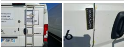
Bouton arrêt porte malle, Manque, E - Remplacer