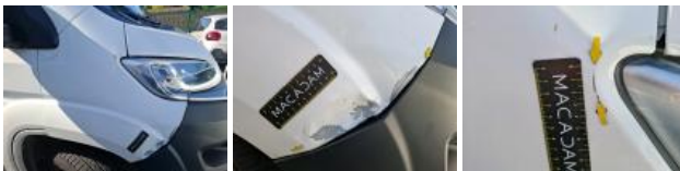
Feu ARG, Fêlure, E - Remplacer