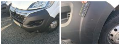
Coin de panneau ARD, Griffe(s), Peindre