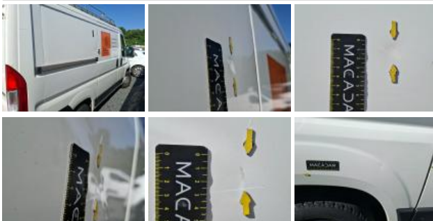
Porte coulissante D, Griffe(s), Peindre