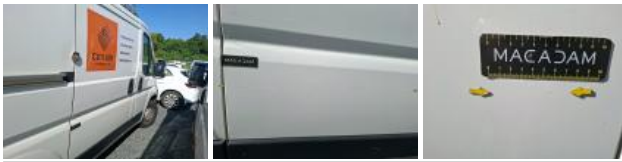
Bas de caisse ext D, Griffe(s), Peindre