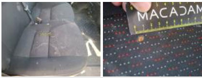
Revêtement dossier AVD, Tache, Nettoyer