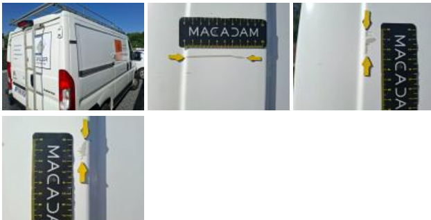
Panneau ARD, Bosse(s) et griffe(s), LI - Réparer et peindre (complet)