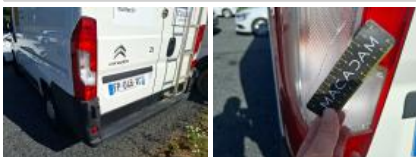
Porte de malle AR D, Griffe(s), Acceptable