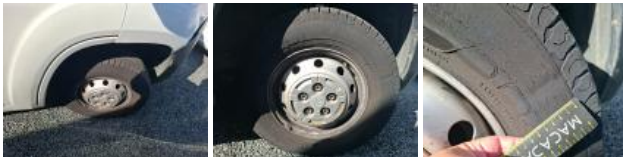
Pneu ARD, Déchirure, E - Remplacer