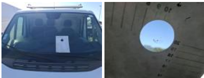
Kit collage vitrage, Nécessaire repose vitrage, Réparer/rempl. (montant forfaitaire)