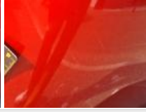
Coin pare-chocs ARD, Griffe(s), Peindre