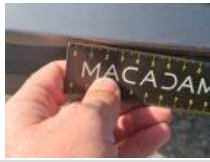
Coin pare-chocs ARG, Griffe(s), Peindre