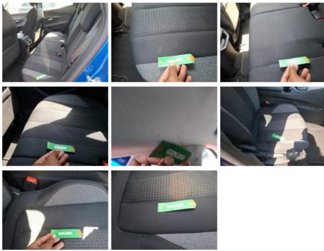
Appui-tête AR M, Déchirure, Réparer/rempl. (montant forfaitaire)