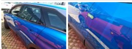
Aile ARG, Bosse(s), LI - Réparer et peindre (complet)