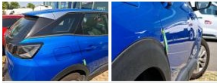
Porte AVD, Bosse(s), LI - Réparer et peindre (complet)