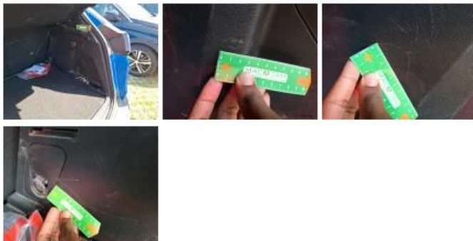
Garnit. int G coffre, Griffe(s), Acceptable