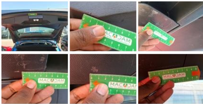
Garnit. int D coffre, Griffe(s), Réparer/rempl. (montant forfaitaire)