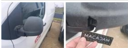
Porte AVG, Eclat(s), Peindre