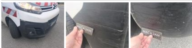
Panneau ARD, Eclat(s), Peindre