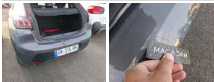
Carrosserie, Grêlé, Forfait grêle (forte)