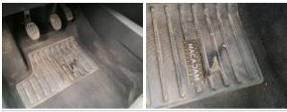
Intérieur, Sale, Nettoyage chimique