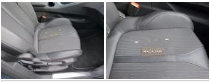
Revêtement assise ARD, Tache, Nettoyer