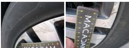
Jante alum. AVG bi-ton/polychrome, Griffe(s), E - Remplacer