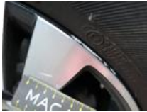
Jante alum. ARD bi-ton/polychrome, Griffe(s), Réparer/rempl. (montant forfaitaire)